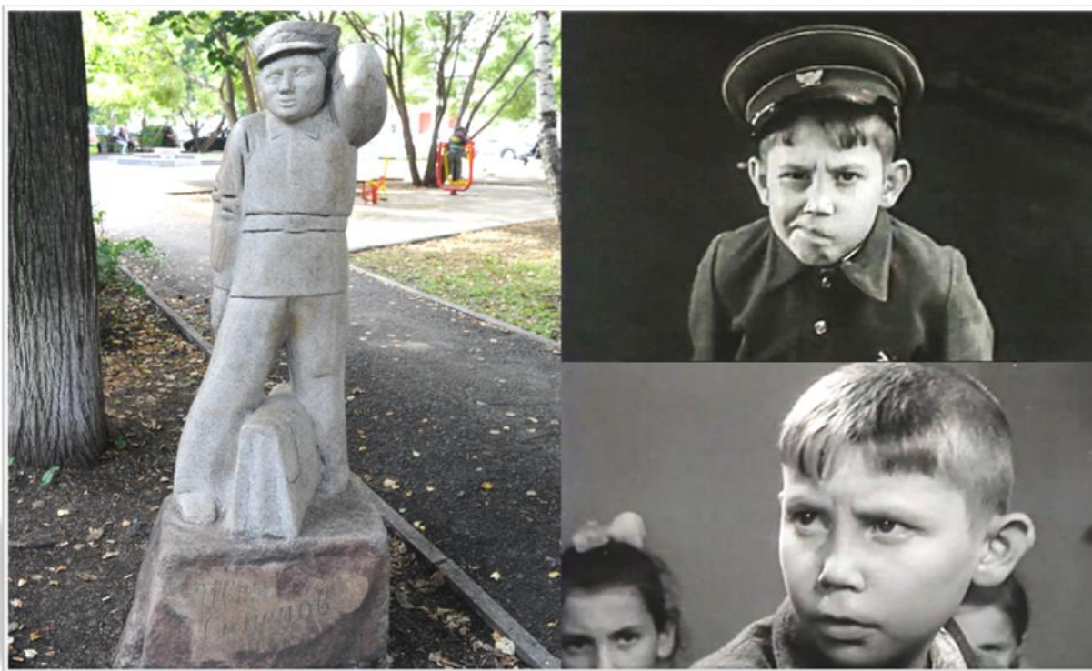
Памятник Ивану Семенову в Перми и герой фильма об Иване Семенове.