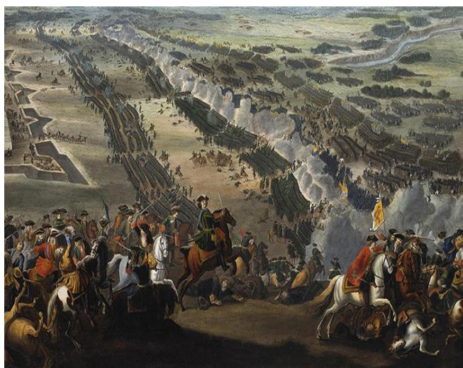
Сражение между русскими и шведскими войсками у Полтавы 27 июня 1709 года. Картина Пьера Дени Мартена Младшего. После 1724 года

В 1708 году Карл решил, что пора окончательно разобраться с Россией, и начал наступление. На этот раз ошибку в расчетах допустил он: исходя из своих представлений о том, как должна вестись война, Карл полагал, что победит Петра в генеральном сражении. Но русские начали отступать, используя при этом тактику выжженной земли: оставляя территории, они угоняли оттуда скот и вывозили зерно.