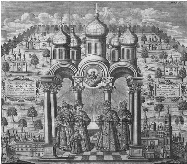
Братья Федор III, Иван V и Петр I ребенком и (справа) патриарх Адриан и митрополит. Гравюра из книги Фридриха Христиана Вебера «Преображенная Россия». 1721 год

У Федора остались два брата — пятнадцатилетний Иоанн (сын первой жены царя Алексея Михайловича, Марии Милославской) и девятилетний Петр (сын второй жены Алексея, Натальи Нарышкиной). У Иоанна тоже были серьезные проблемы со здоровьем, и было очевидно, что как самодержавный государь он править не сможет. Нарышкины, выражаясь современным языком, подсуетились: воспользовавшись поддержкой духовенства, они созвали нечто вроде земского собора (хотя некоторые историки сомневаются, были ли этот собор действительно собран) и провозгласили царем Петра.