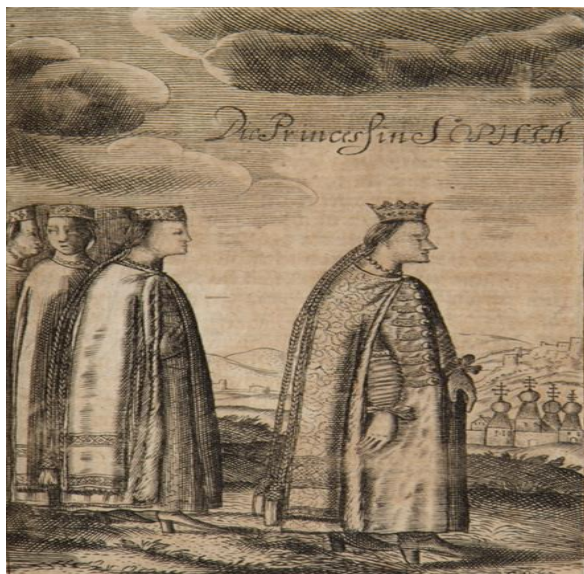
Царевна Софья. XVII век

полноценной самодержавной государыней, а уже потом приступить к реформам. Принято также считать, что какой-то план преобразований был у ближайшего к Софье человека — князя Василия Васильевича Голицына. Но сведения об этом довольно скудные: французский дипломат де ла Нёвилль в своих записках сообщает, что Голицын был образованным человеком, знал иностранные языки, носил европейское платье и говорил Нёвиллю о каких-то планах преобразований. О серьезности и масштабе этих преобразований мы можем только догадываться. Однако уже вступление России в Священную лигу говорит о многом.