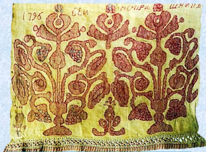
ОРЛОВСКИЙ СПИС. 1796 ГОД

До нас дошли вышивки XVIII - начала XX века: полотенца, скатерти. Самое раннее полотенце датировано 1796 годом. Преобладающий цвет в вышивке – различные оттенки красного. Постепенно добавлялся синий, а позднее – черный, желтый, зеленый. Отличительной чертой "орловского списка" является многоликость, уникальность. В его изменчивых формах можно увидеть много различных символов, фигур, очертаний животных. Настоящий список спонтанный, не имеет границ.