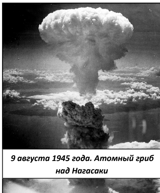
9 августа 1945 года. Атомный гриб над Нагасаки

Результаты ядерной бомбардировки японских городов Хиросима и Нагасаки привели к подписанию пактов о нераспространении оружия массового поражения, запрете на его производство и применение.