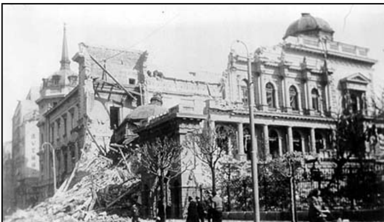
Белград после бомбардировок

За шесть лет тотальному разрушению подверглось множество крупных городов, в том числе и некоторые столицы государств. Масштаб разрушений был таков, что после окончания войны эти города строились практически заново. Многие культурные ценности были безвозвратно утрачены.