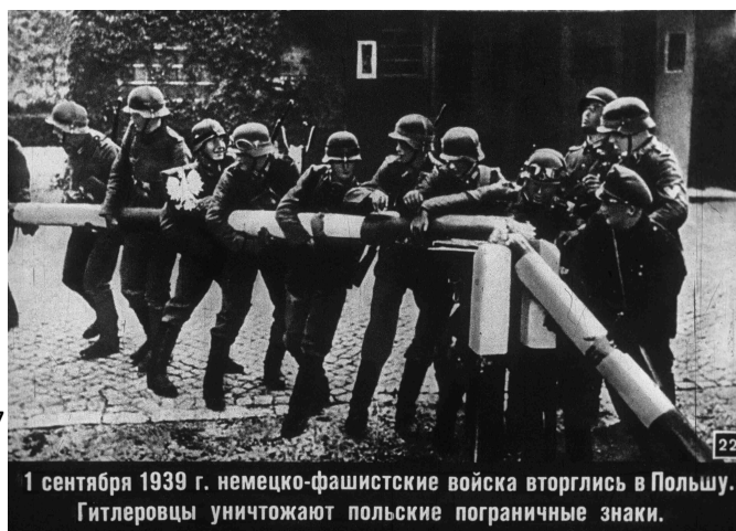
1 сентября 1939 г. немецко-фашистские войска вторглись в Польшу. Гитлеровцы уничтожают польские пограничные знаки.

Получив надежный тыл, Германия начала активную