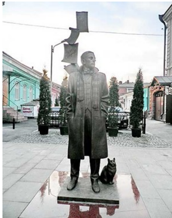
Шариков, г. Владикавказ