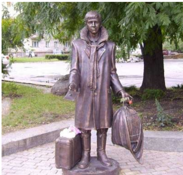
Лариосик, г. Киев