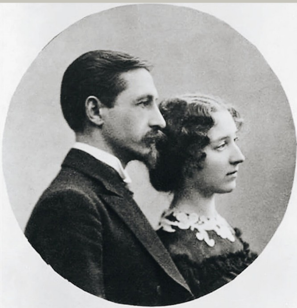
И.А. Бунин и В.Н. Муромцева

книжной лавке. Многочисленные встречи, знакомства, наблюдения обогащают его новыми впечатлениями.