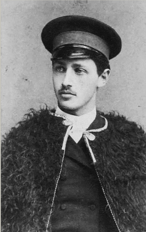
И. А. Бунин в молодости