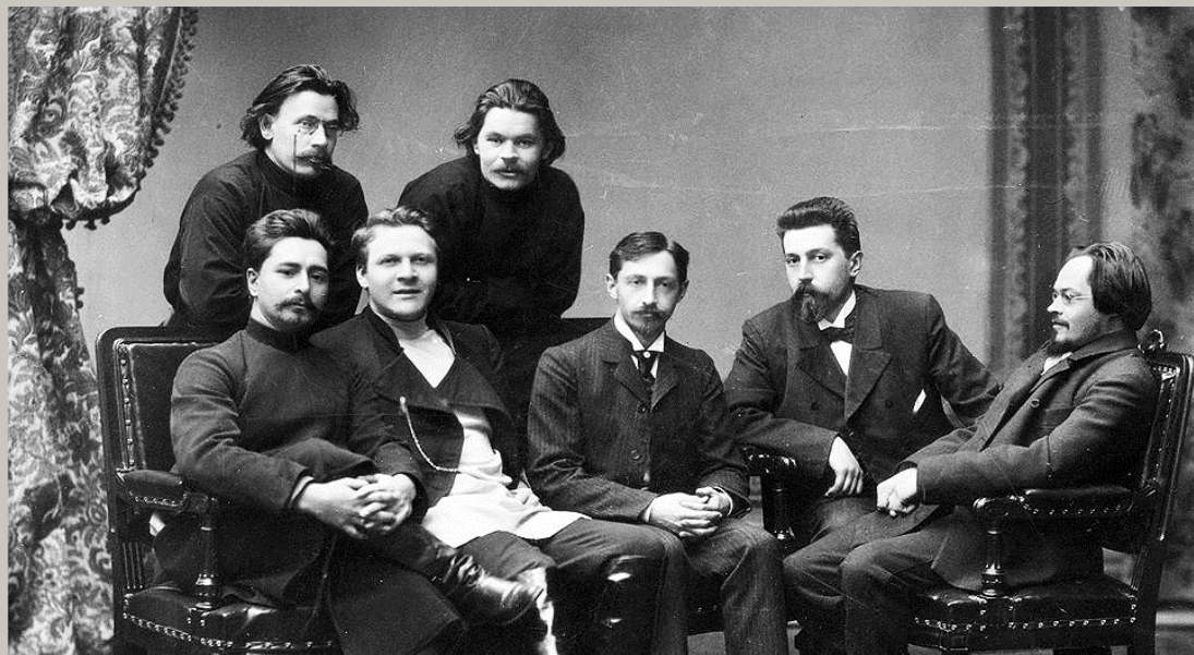
Участники литературного объединения «Среды». Стоят (слева направо) — Скиталец (С. Г. Петров), Максим Горький. Сидят (слева направо) — Леонид Андреев, Федор Шаляпин, Иван Бунин, Николай Телешов, Константин

Тридцать три года, около половины творческой жизни, вплоть до кончины в 1953 г., провел Бунин во Франции, живя и работая вдали от горячо любимой России. Во время второй мировой войны, оставаясь на оккупированной фашистами французской земле, он отверг все их предложения о сотрудничестве, с волнением следил за событиями на