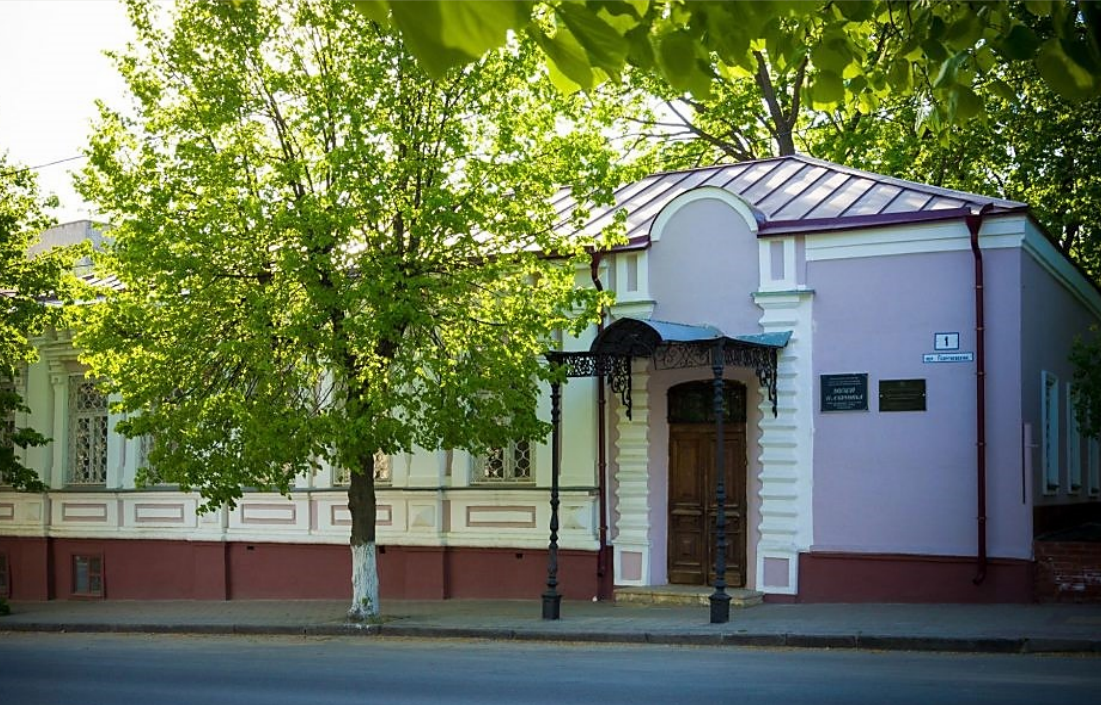
Дом-музей И.А. Бунина в Орле

Дома он еще больше увлекся литературой. В 1887 году в петербургской газете «Родина» Бунин опубликовал свои стихотворения — «Над могилой С.Я. Надсона» и «Деревенский нищий», а чуть позже — рассказы «Два странника» и «Нефедка». В своем творчестве он постоянно обращался к детским воспоминаниям.