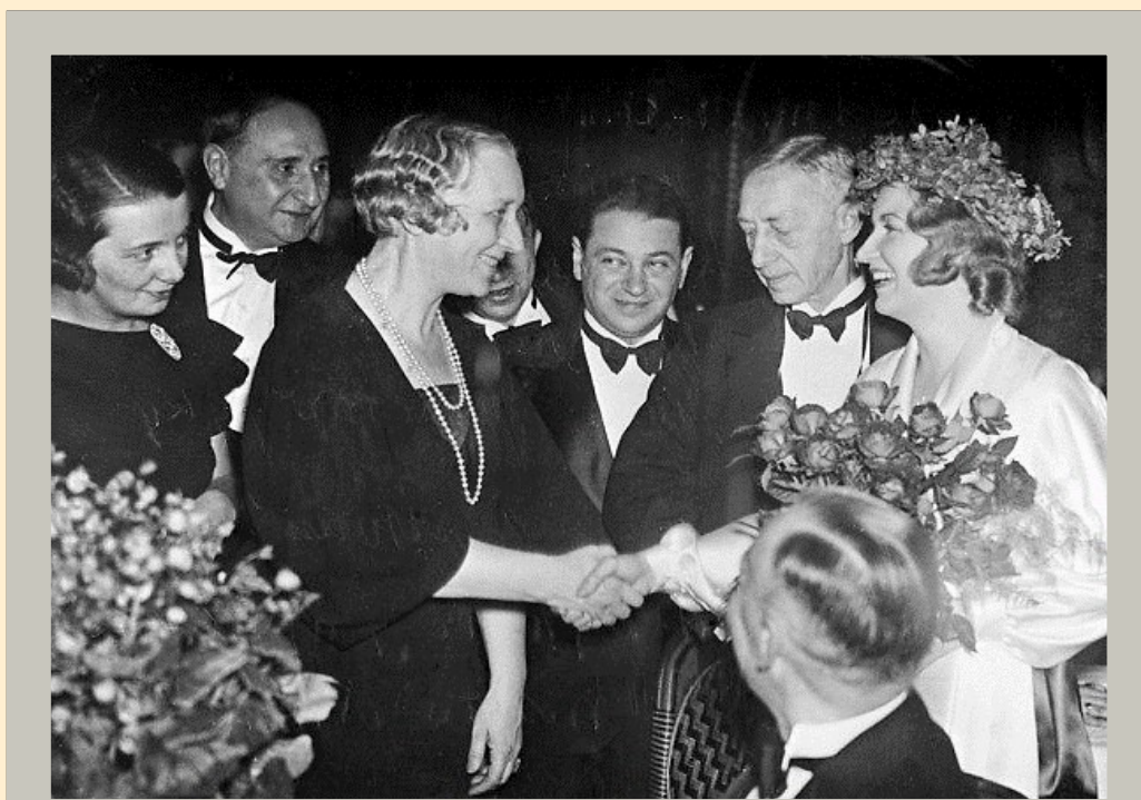
И.А. Бунин с женой на вручении Нобелевской премии в Стокгольме, 1933 г.

Оказавшись изгнанником, он как никто другой жестоко страдал вдали от родины, постоянно ощущая всю глубину потери. О том, как велика тяга писателя к соотечественникам, как глубока его любовь к России, свидетельствует его рассказ «Косцы», где речь идет о рязанских крестьянах, их вдохновенном труде, берущем за душу пении во время сенокоса на орловской земле. В «Жизни Арсеньева», самом замечательном произведении, созданном в эмиграции, преобладает чувство любви. Роман этот определяют как художественную биографию творческой личности.