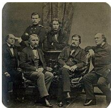
Члены редколлегии журнала «Современник» (Островский справа). 1856 г.

В 1856 году писатель вступил в коллектив популярного издания «Современник», куда входили: И. А. Гончаров, И. С. Тургенев, А. В. Дружинин, Л. Н. Толстой, Д. В. Григорович.