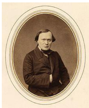
А. Н. Островский, 1856 г.

Первой пьесой, которая пробилась на театральную сцену, стала «Не в свои сани не садись». В 1853 году она появилась на подмостках Малого театра. Эта пьеса и вышедшая следом «Бедность не порок» совершили самую настоящую революцию в мире театра.