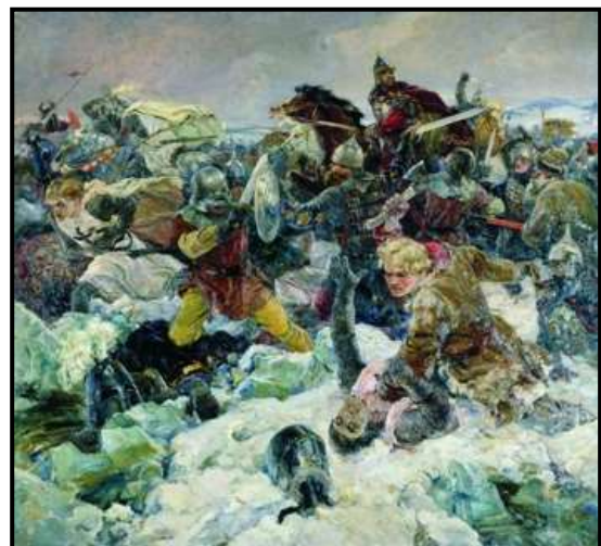
Серов В. А. «Ледовое побоище»