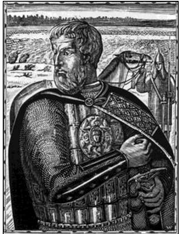
Фаворский В. А. «Александр Невский» (гравюра)