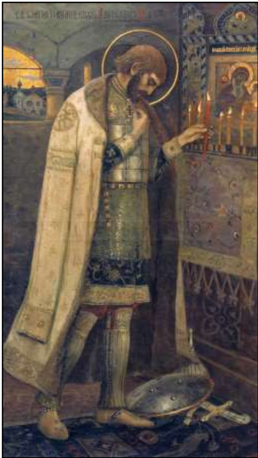
Нестеров Н. В. «Благоверный князь Александр Невский»