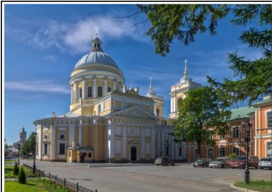
Александро-Невская лавра в Санкт-Петербурге