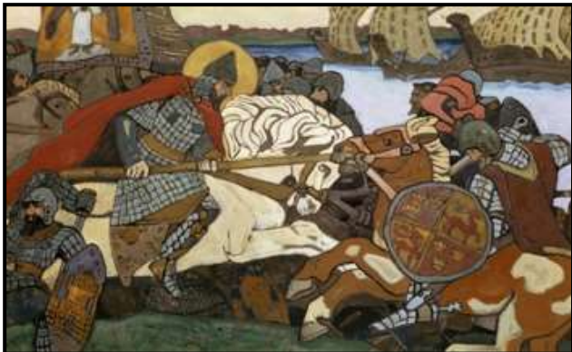
Рерих Н. «Александр Невский поражает ярла Биргера»