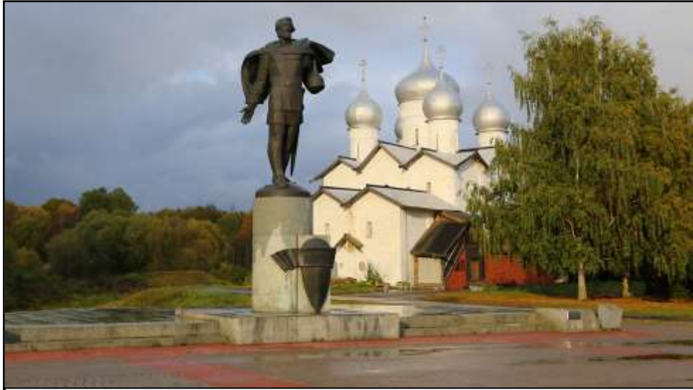
Чернов Ю. Памятник Александру Невскому в Новгороде