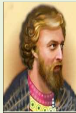
Всеволод Большое Гнездо