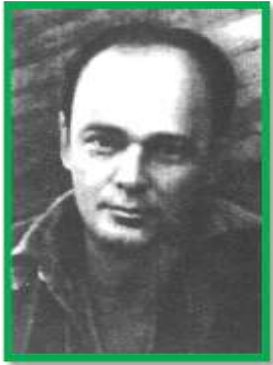
Евгений Иванович Чарушин (1901 - 1965)

Русский художник и писатель, книжный график.