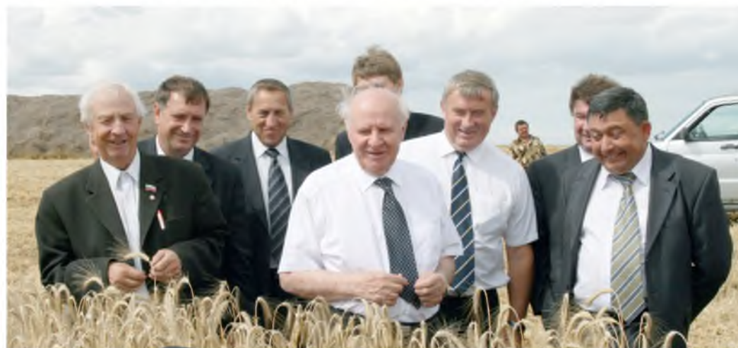
Строев на орловских полях

Ещё с весны 1995 года Строев руководил ассоциацией «Черноземье» (с вступлением в неё и других регионов она в 2001 году стала ассоциацией всего Центра России). Возглавлял и координационный совет межрегиональных ассоциаций страны. Регулярные встречи в таком формате губернаторов, председателей законодательных собраний порождали массу идей, шёл интенсивный обмен опытом, было разработано множество программ развития — от промышленности, энергетики и науки до культуры и подготовки кадров.