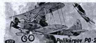
У-2 завоевал имя создателя — ПО-2

Оценивая успехи авиастроителей, коллеги ОГПУ решила осудить его условно. И постановлением ЦИК СССР от 7 июля 1931 года на следующий день