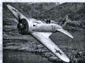
«Ишак» всех фронтов