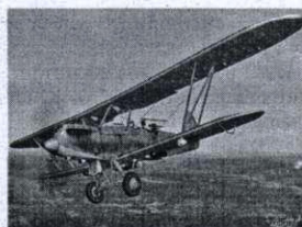
Первопроходец Заполярья Р-5