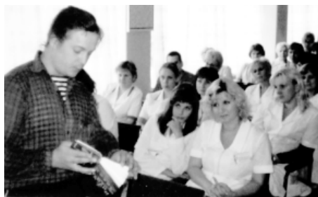
На встрече с читателями