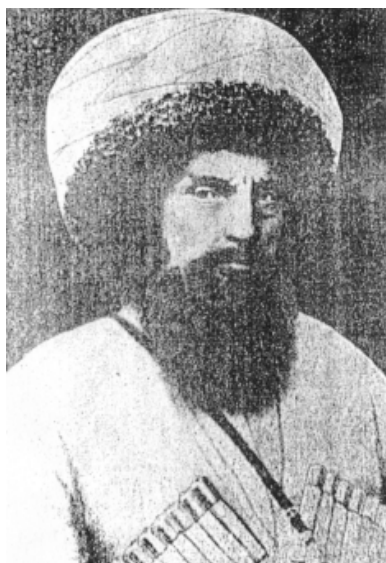
Имам Дагестана и Чечни Шамиль (1799–1871)