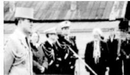
Французская военная делегация почтила память лётчиков эскадрильи «Нормандия», погибших на орловской земле