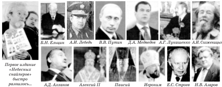
Первое издание «Небесных снайперов» быстро разошлось...