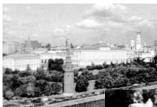
Орёл — Москва — Орёл.

Не только по требованиям и просьбам Александра Лебеда и Льва Рохлина настало время остановиться и прекратить междоусобицу, начинающую напоминать многолетнюю бойню Израиля и Палестины. Думающие и работающие президенты и парламенты России и Чечни должны наконец понять, что навстречу друг другу нужно идти без оружия.