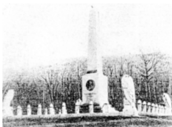
Памятник на месте дуэли великого поэта