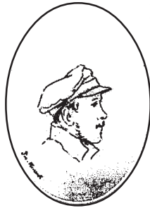
М.Ю. Лермонтов. Рисунок Д.П. Палена. 1840