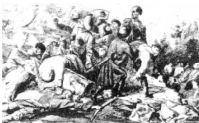
Эпизод сражения при Валерике. Рисунок М.Ю. Лермонтова и Г.Г. Гагарина