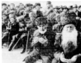
Аллах акбар! Аллах велик!