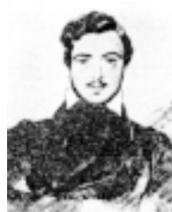
Художник- баталист Г.Г. Гагарин

А там, вдали, грядой нестройной, Но вечно гордой и спокойной, Тянулись горы — и Казбек Сверкал главой остроконечной. И с грустью тайной и сердечной Я думал: «Жалкий человек. Чего он хочет!.. небо ясно, Под небом места хватит всем, Но беспрестанно и напрасно Один враждует он — зачем?»