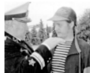
Моряку Сергею Рассохиному пригодился опыт контр- адмирала Л.М. Сальникова