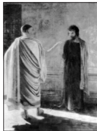
«Что есть истина?» (Христос и Пилат). Николай Ге