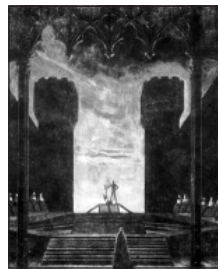
Казнь королевы. Эскиз декорации финала оперы Г. Доницетти «Мария Стюарт». Николай Бенуа