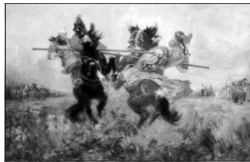
Поединок на Куликовом поле (Пересвет с Челубеем). Михаил Авилов