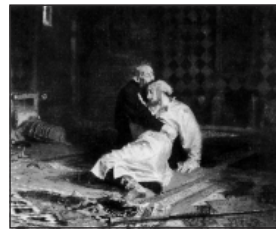
Иван Грозный и сын его Иван 16 ноября 1581 года. Илья Репин