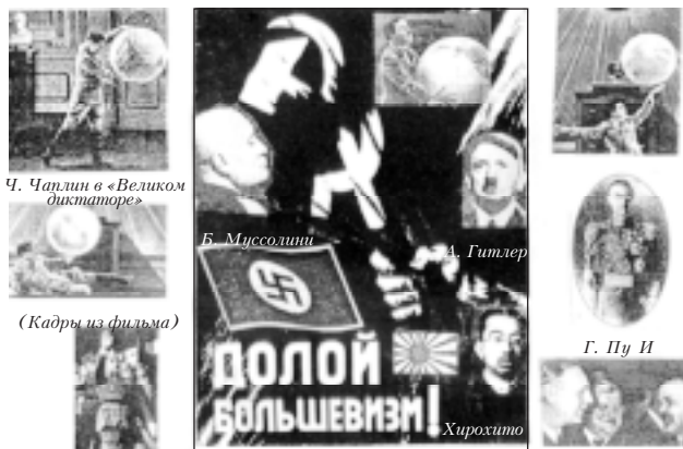
Ч. Чаплин в «Великом диктаторе»