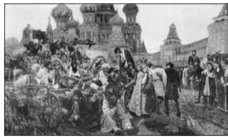
Утро стрелецкой казни. Василий Суриков