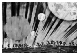
Новая планета. Константин Юон

Отвечайте им, Бога ради, Те, в ком чёрная бродит сила, Что вам думать о новом аде МАТЬ ВСЕЛЕННАЯ запретила!