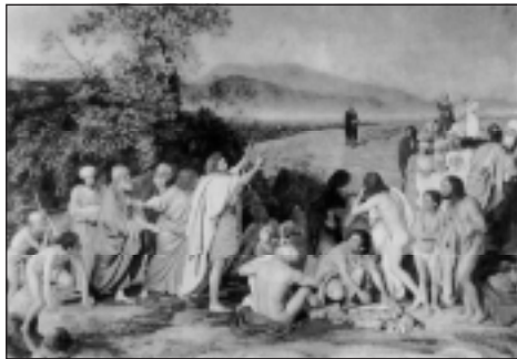
Явление Христа народу (Явление Мессии). Александр Иванов