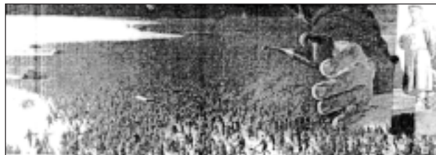
П. Белов «1941-й год» («Рука вождя»)