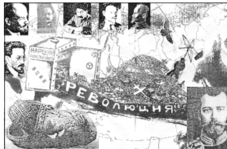
Демоны революции и авторы неограниченной власти — В. Ленин, Л. Троцкий, И. Сталин, М. Калинин, Ф. Держинский, Я. Свердлов. За ними — расстрел царя Николая II и его семьи, подавление права и Церкви, крестьянства и культуры