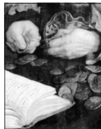
Редкие мастера обращались к силе денег, предательства, власти и бичевали её за подавление человека