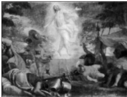
Воскресение Христа. Паоло Веронезе