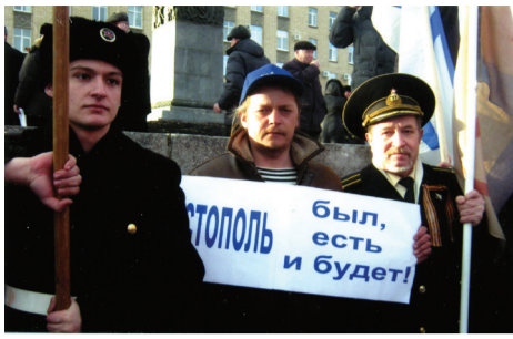
Автор (в центре) на митинге в Орле в честь присоединения Крыма к России