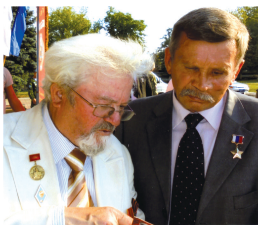
Автограф Герою России Вячеславу Алексеевичу Бочарову