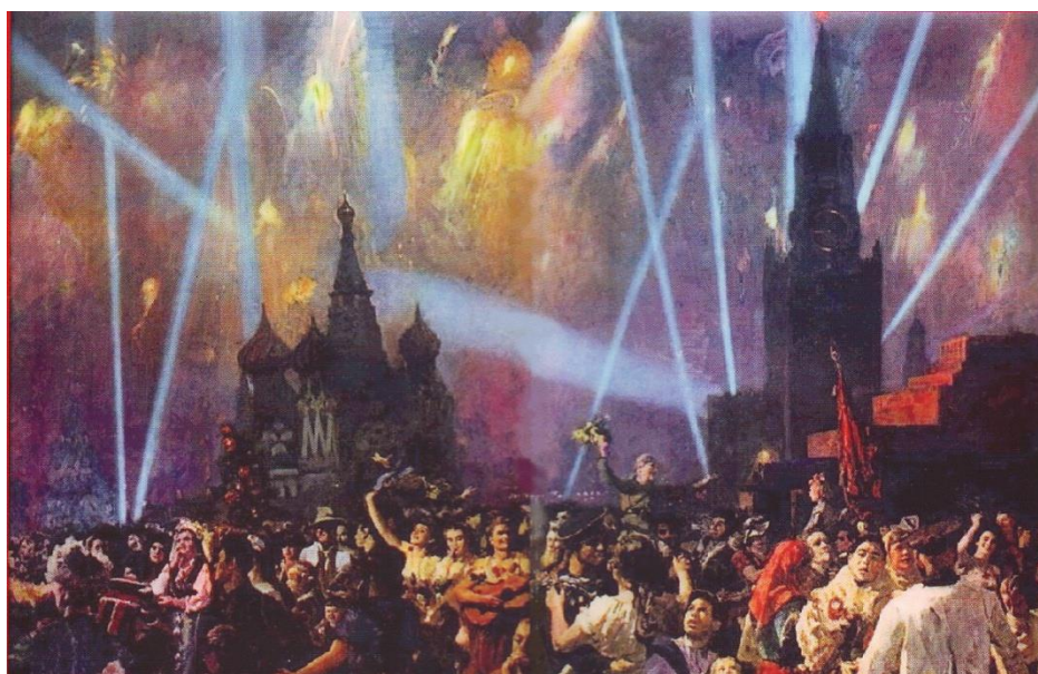
Праздник Победы. Худ. Б. Иогансон. 1947 г.