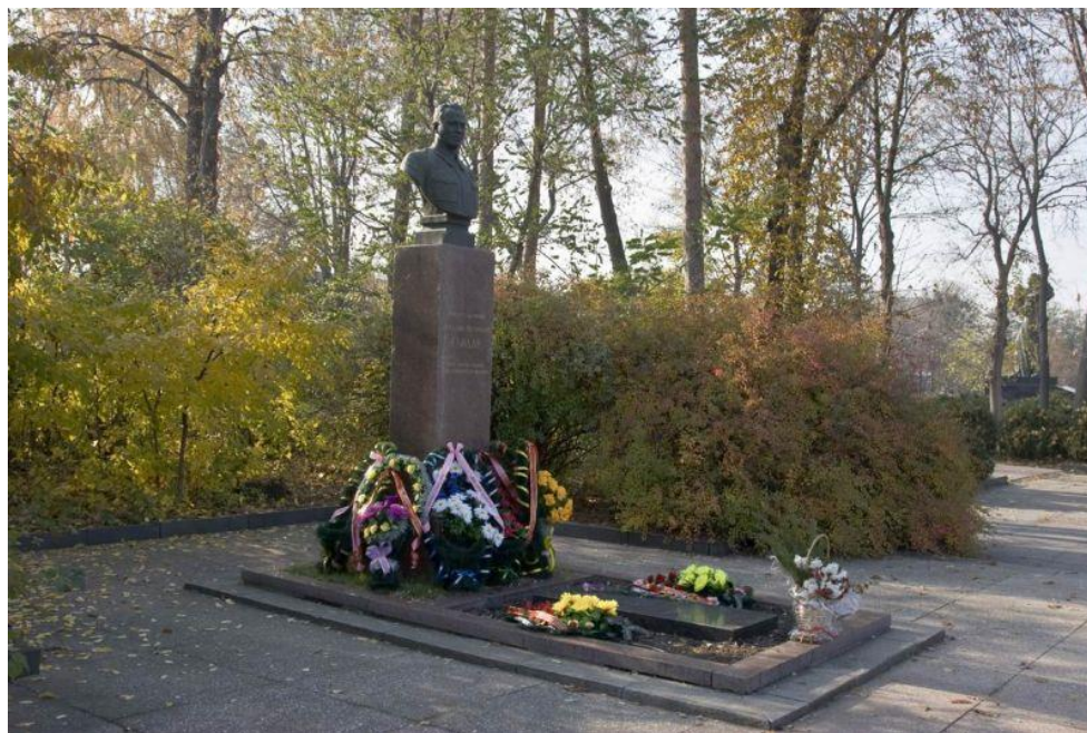
Могила А. П. Гайдара в Каневе