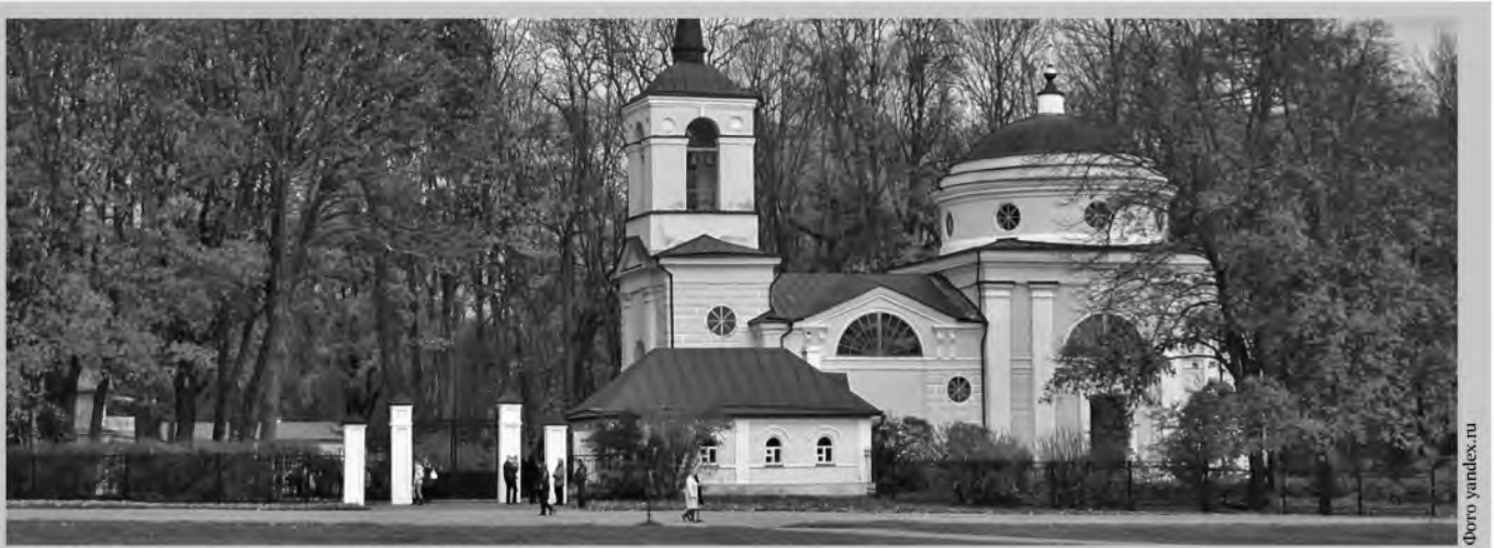
Спасо-Преображенский храм в Спасском-Лутовинове