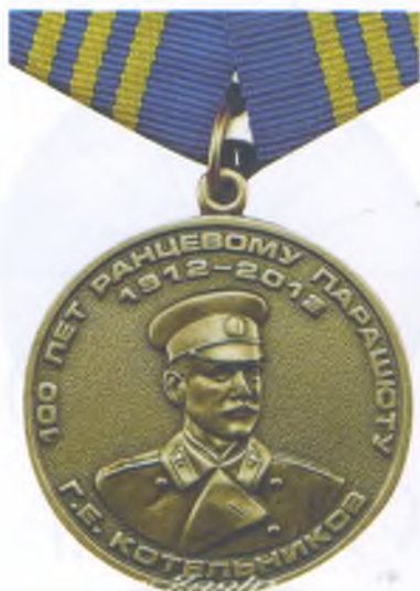
Медаль к 100-летию ранцевого парашюта Котельникова