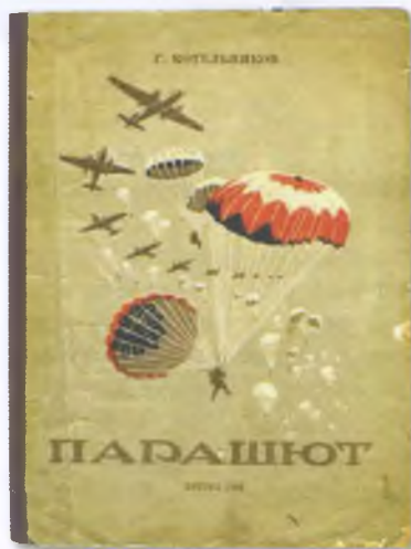
Книга Котельникова по изучению парашюта