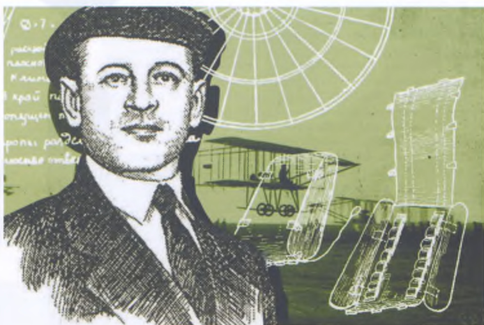
Схема устройства парашюта

С высоты XXI века поразительно, что князь Александр Михайлович, первоначальник Российских Воздушных Сил, выступил против... внедрения «ноу-хау»: «Парашют вообще в авиации вещь вредная!» (видимо, опасались частого оставления машин в небе из-за незначительных причин или поломок). Мудрый Котельников предусмотрительно патентует «РК-1» на Родине «трёх мушкетёров» (документ №438 612) в конце марта 1912-го, чем достиг мирового признания эпохального изобретения.