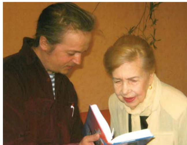
С. Рассохин с народной артисткой СССР И. В. Макаровой — исполнительницей роли Л. Шевцовой в фильме «Молодая гвардия»

Писателями не рождаются — это факт. Знаковым итогом деятельности Рассохиных, обновивших и дополнивших подарочное издание «Штурмующий небо» к 70-летию освобождения Родины от оккупантов, явился суммарный тираж