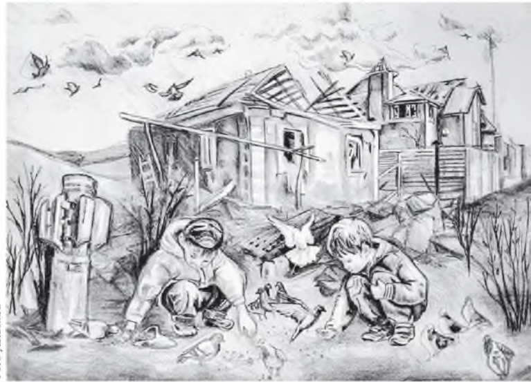
Из серии детских рисунков о Донбассе